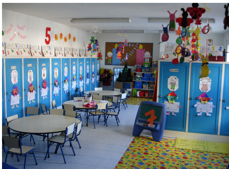
Aspecto geral da sala dos 5 anos

Através do nosso Jornal vamos dar a conhecer a nossa instituição e neste primeiro número apresentamos a sala dos 5 anos.