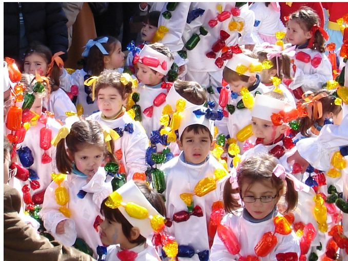
Sala dos 3 anos