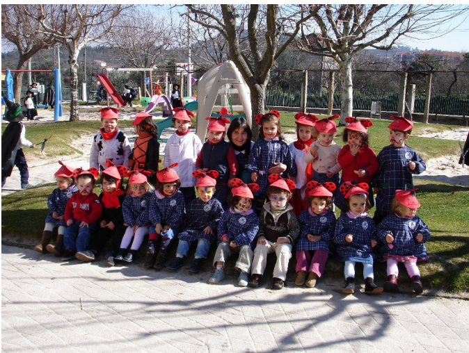
Sala dos 2 anos

A alegria e a cor marcaram presença nas ruas da cidade de Mangualde.