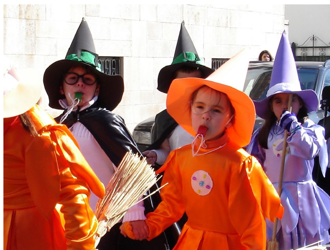
Sala dos 5 anos