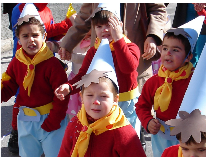
Sala dos 4 anos