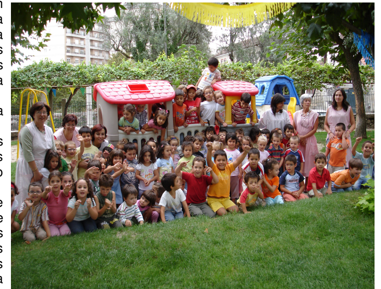
O Polegarzinho deseja “Boas vindas”

É natural e frequente verem-se bailar algumas lágrimas nos olhos dos pais e às crianças, nesta separação diária e nesta fase de adaptação mútua